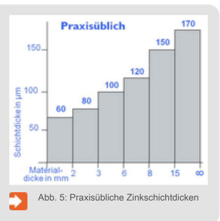
Abb. 5: Praxisübliche Zinkschichtdicken

Anforderungen gestellt, so sind hierüber zwischen Auftraggeber und Auftragnehmer im Vorfeld Vereinbarungen zu treffen.