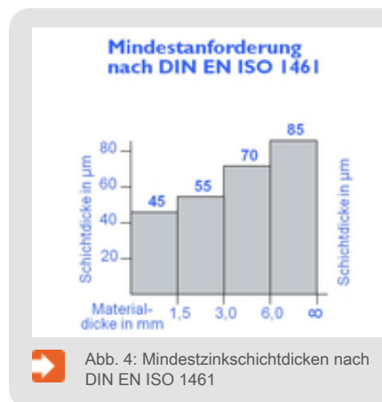
Abb. 4: Mindestzinkschichtdicken nach DIN EN ISO 1461

Ein wesentliches Kriterium für die Güte einer Feuerverzinkung ist die Dicke des Zinküberzuges. Sie wird in µm gemessen (1 µm = 1/1 000 mm), seltener als flächenbezogene Masse in g/m 2 angegeben. In DIN EN ISO 1461 "Durch Feuerverzinken auf Stahl aufgebrauchte Zinküberzüge (Stückverzinken)" sind die Mindestwerte der geforderten Überzugsdicken angegeben, wie sie je nach Materialdicke beim Stückverzinken zu liefern sind (Abb. 4). Werden insbesondere an das Aussehen und die Dicke von Zinküberzügen besondere