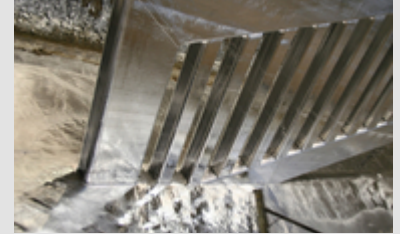
Abb. 3: Feuerverzinktes Bauteil im Zinkbad

Nach dem Trocknen wird das Verzinkungsgut in die flüssige Zinkschmelze getaucht. Zink hat eine Schmelztemperatur von ca. 419 °C. Die Betriebstemperatur eines Verzinkungsbades liegt in den meisten Betrieben zwischen 440° bis 460 °C. In besonderen Fällen kann die Zinkbadtemperatur auch bei mehr als 530 °C liegen (Hochtemperaturverzinkung). Der Zinkgehalt der Schmelze liegt gemäß DIN EN ISO 1461 bei mindestens 98 %. Zinkschmelzen werden üblicherweise mit anderen Metallen legiert um ein optimales Verzinkungsergebnis zu erzielen. Nach dem Eintauchen des Verzinkungsgutes in das geschmolzene Zink verbleiben die Teile im Zinkbad bis sie dessen Temperatur angenommen haben. Nach dem "Abkochen" des Flussmittels wird die Oberfläche des Zinkbades von Oxiden und Flussmittelresten gereinigt. Danach wird das Verzinkungsgut wieder aus der Zinkschmelze gezogen (Abb. 3). Beim Verzinkungsvorgang bildet sich als Folge einer wechselseitigen Diffusion des flüssigen Zinks mit dem Eisen im Stahl ein Überzug verschiedenartig zusammengesetzter Eisen-Zink-Legierungsschichten. Beim Herausziehen der feuerverzinkten Gegenstände bleibt auf der obersten Legierungsschicht zumeist noch eine Schicht aus Zink haften, die in ihrer Zusammensetzung der Zinkschmelze entspricht.